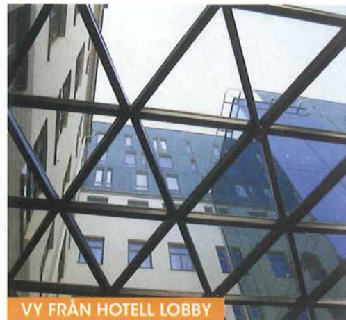
VV FRÅN HOTELL LOBBY