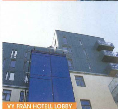
VV FRÅN HOTELL LOBBY